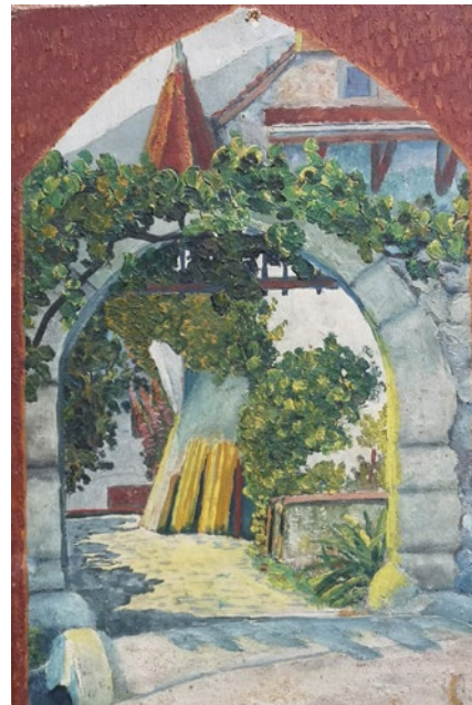
unbekannt, Der Hof mit Tor (Inv. RBM1801)