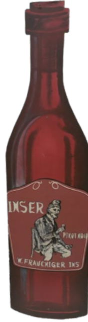
Werbetafel Weinflasche «Inser / Pinot noir / W. Frauchiger / Ins»