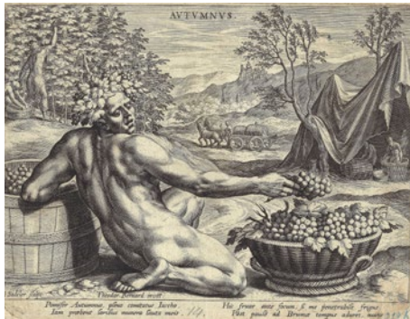
Autumnus, Druckgrafik von Jan Sadeler, um 1580 (Inv. RBM1845)

In den Schränken des Rebbaumuseums lagert eine unglaublich reichhaltige Sammlung von Stichen, Lithografien, Zeichnungen, Bildern und Fotografien. Zum Thema Läset haben wir eine bunte Palette von diesen Abbildungen in Szene gesetzt.