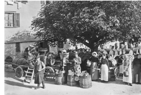
Läset in der Kellerei Engel&Hubacher in Kleintwann, um 1925

Über Lithografien, Zeichnungen, Ölbilder, Aquarelle und im 20. Jh. dann Fotografien führen uns die verschiedensten Bilder von Weinernten bis zum heutigen Tag. Sind die Fotografien vertrauenswürdiger? Stehen die Läsetlüt nicht extra schön in der Reihe, oft im Sonntagsstaat, um sich ablichten zu lassen? Läset gab es auch bei Regen und Schnee und die Ernte fiel viel zu oft schlecht und mangelhaft aus.