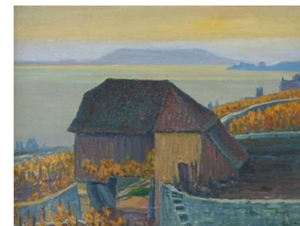
Otto Clélin, Altes Schützenhaus von Ligerz, o.D. (Inv. RBM1795)