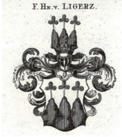
ExLibris «F.Hn.v. Ligerz», um 1820 (Inv. RBM1817)