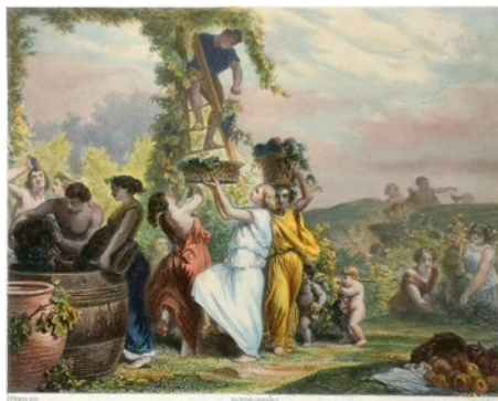
Les Vendanges, L.E. Le Roux nach einer Vorlage von J.F. Gigoux, um 1835 (Inv. RBM 1834)

Der 'einfache Mann' - die Arbeiter und die Leserinnen selbst sind in den älteren Abbildungen – wenn überhaupt – nur im Hintergrund zu sehen. Erst langsam rücken sie ins Zentrum. Aber die Traubenlese wird oft romantisierend und idyllisch dargestellt: Adrett in wallende Roben oder in bunte Trachten gekleidete Mädchen stehen im Rebberg zum Trauben schneiden. Junge kräftige Männer tragen Brenten im Rebberg und füllen die Züber und Traubenpressen im Keller. «Nun, endlich kommt der Freudentag. Das ist ein sprühend frohes Fest und eines mühsamen Jahres reicher Segen.» Schmerzensde Rücken werden schnell vergessen.